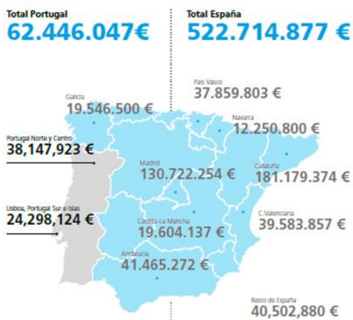
Empresas participantes en 2021-22

Financiación total por región (Total 585.160.924 €)